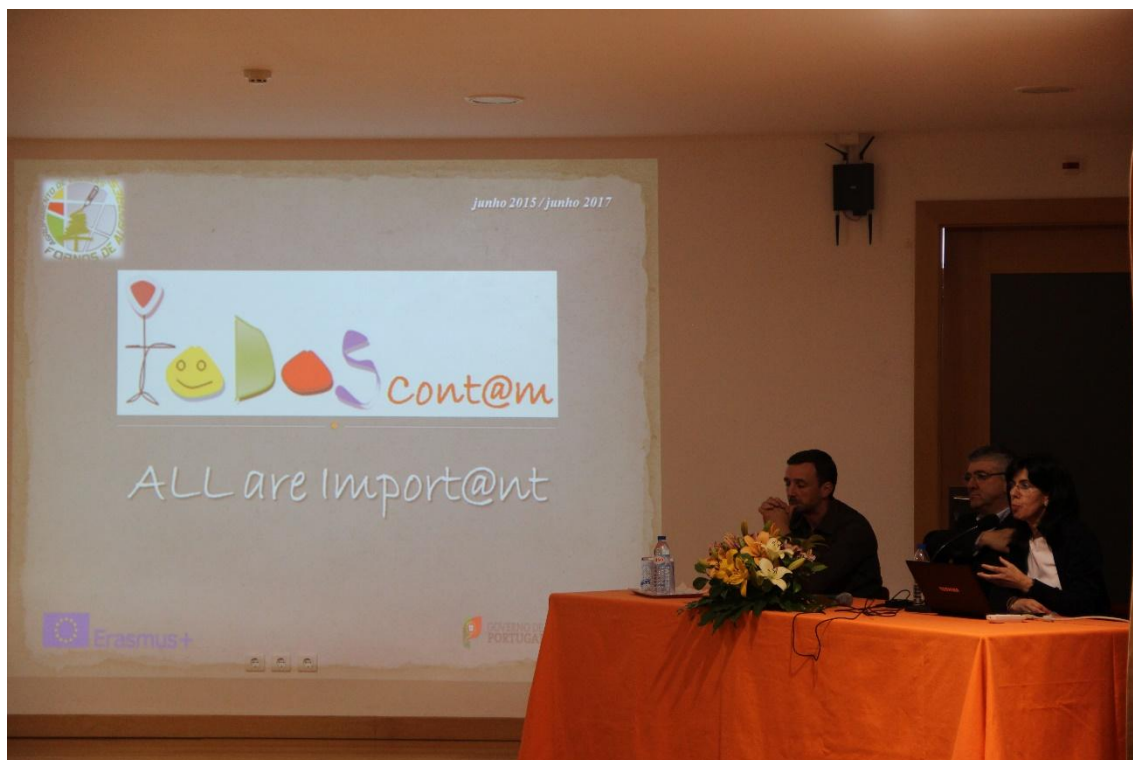
Apresentação pública do projeto – junho 2015